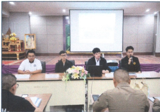
วิทยากรจากสำนักสำรวจและออกแบบ กรมทางหลวง