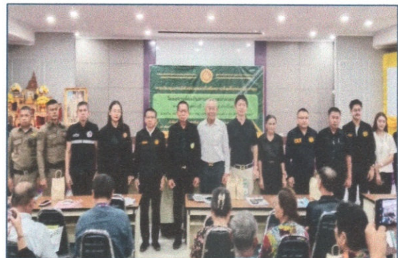
หัวหน้าส่วนราชการถ่ายรูปร่วมกับประธาน